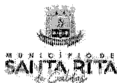
Tabela Anexo 1